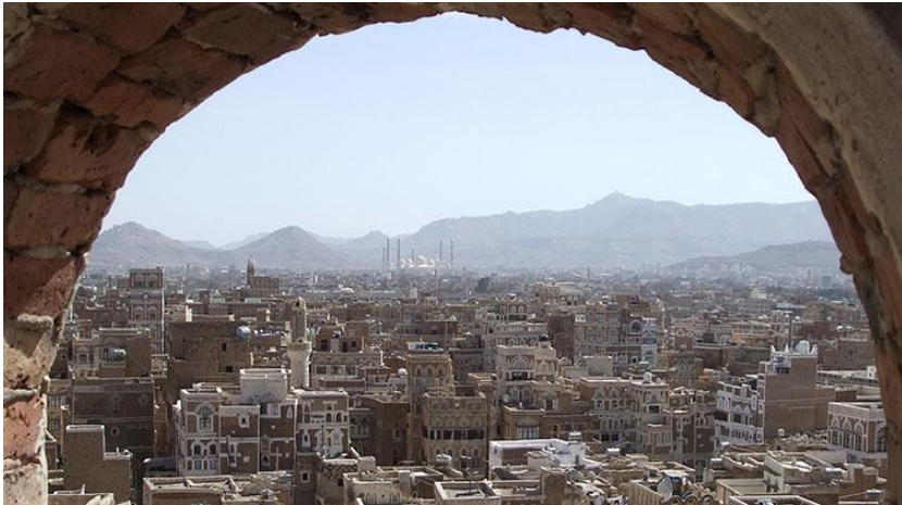
Blick über die jemenitische Hauptstadt Sanaa